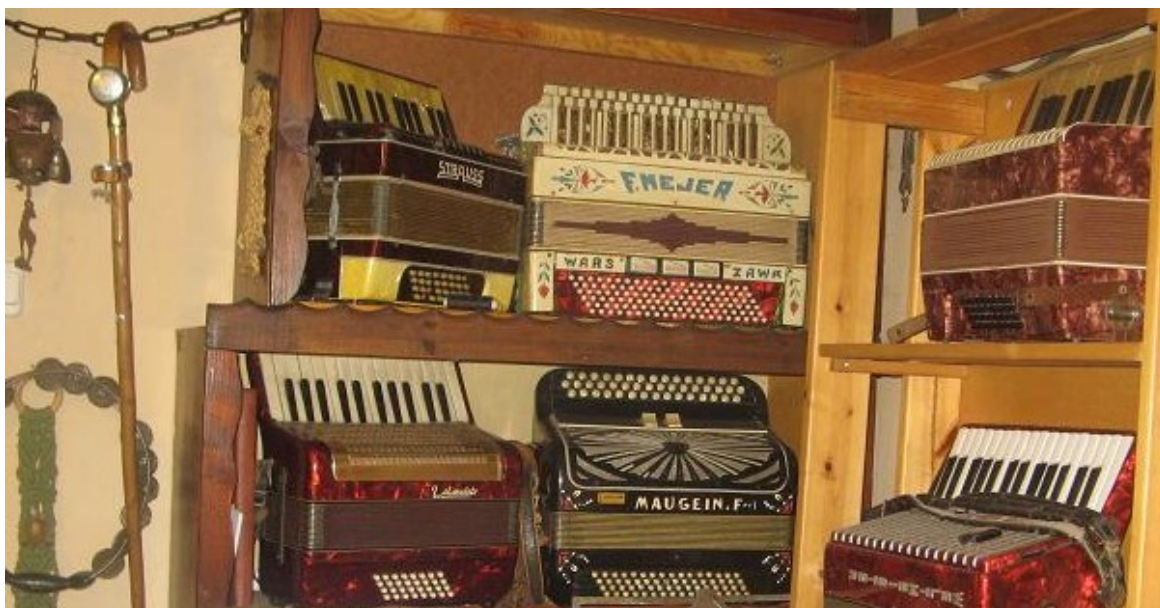
izba z muzycznymi eksponatami