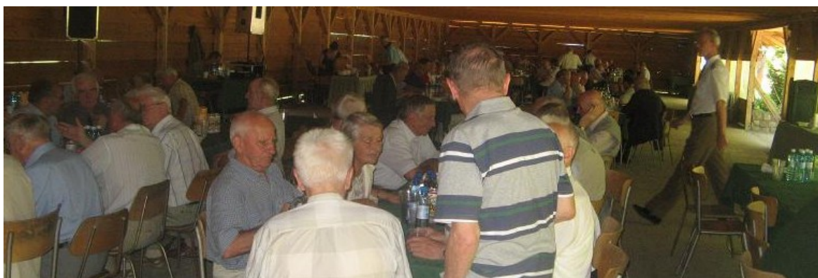
Ogólny widok na salę spotkań

Szczegóły z obchodów w poszczególnych Kołach przedstawili Członkowie WKR oraz zapoznaliśmy się z wpisami na stronie internetowej.