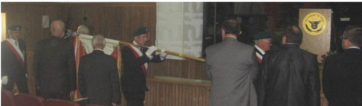
Wejście pocztu honorowego ze sztandarem ZZWP

Uroczystości przebiegały zgodnie z planem. W nabożeństwie uczestniczyło kilkanaście osób w tym z Koła „Saper” – 8! Z Komitetu Honorowego i zaproszonych gości uczestniczyło kilka osób. Impreza w WSOWLąd b. elegancka. Sprawny i miły udział orkiestry – był odebrany pozytywnie. Na Rakowie, brakowało np. pokazu ujeżdżania koni lub czegoś podobnego, aby „rozruszać” – Biesiadników!