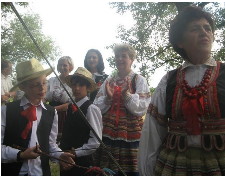
Występ w części nieoficjalnej

(Tak na marginesie sprawozdania, w m. Marcinowo k/Trzebnicy jest „Małe Muzeum Ludowe u Kowalskich”, gdzie każdy z odwiedzających znajdzie „kawałek” historii z Dolnego Śląska i nie tylko. Każdy: Kobieta, Mężczyzna, Dziecko, Strażak, Wojskowy...itd. Znajdzie coś dla siebie! Marzeniem Kustosza tego Muzeum jest zdobycie „wiodącego” przedmiotu z poszczególnego rodzaju wojsk: np. czołgu, samolotu, itd. Od „Saperów” ... myślał i marzył o amfibii).