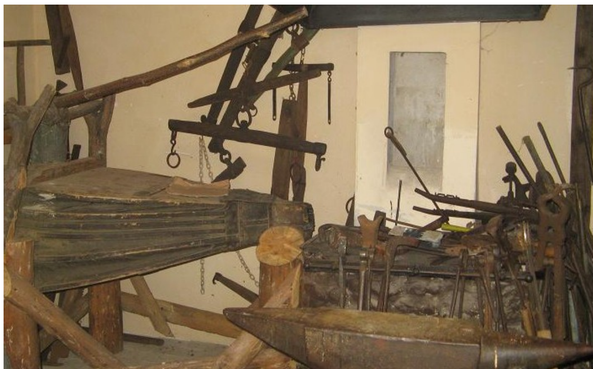
Izba z elementami i narzędziami kuźni

(Tak na marginesie sprawozdania, w m. Marcinowo k/Trzebnicy jest „Małe Muzeum Ludowe u Kowalskich”, gdzie każdy z odwiedzających znajdzie „kawałek” historii z Dolnego Śląska i nie tylko. Każdy: Kobieta, Mężczyzna, Dziecko, Strażak, Wojskowy...itd. Znajdzie coś dla siebie! Marzeniem Kustosza tego Muzeum jest zdobycie „wiodącego” przedmiotu z poszczególnego rodzaju wojsk: np. czołgu, samolotu, itd. Od „Saperów” ... myślał i marzył o amfibii).